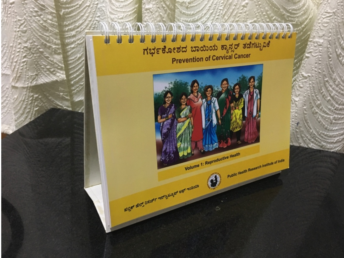
Supplement Figure 1a. Flipbook cover page

Supplement Figure 1. Images from visual education flipbooks for community-based prevention of cervical cancer, Mysore, India, 2010-2018